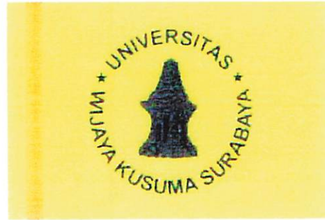
Fakultas Ilmu Sosial dan Ilmu Politik