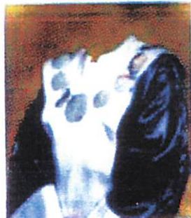
Fakultas Ekonomi dan Bisnis