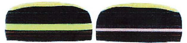
Fakultas Kedokteran Hewan