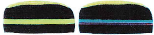
Fakultas Bahasa dan Sains