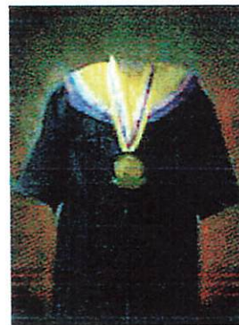
Fakultas Kedokteran Hewan