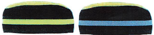
Fakultas Ekonomi dan Bisnis