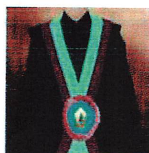
Fakultas Bahasa dan Sains