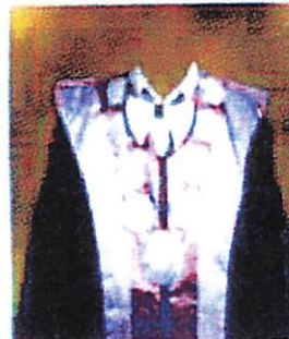
Fakultas Kedokteran Hewan