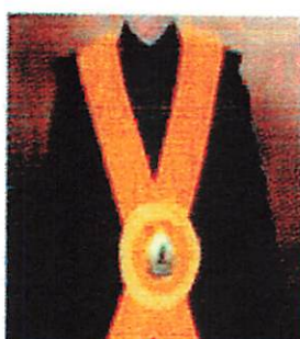
Fakultas Ilmu Sosial dan Ilmu Politik