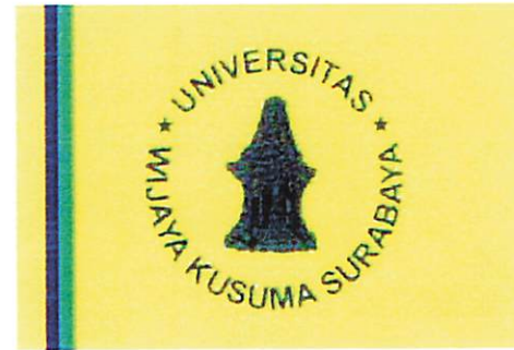
Fakultas Bahasa dan Sains