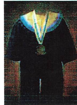
Fakultas Bahasa dan Sains