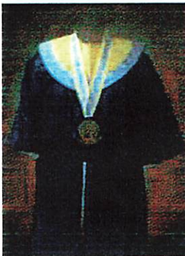
Fakultas Ekonomi dan Bisnis