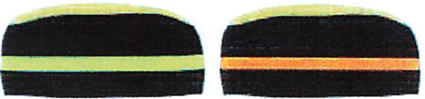
Fakultas Ilmu Sosial dan Ilmu Politik