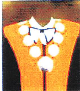
Fakultas Ilmu Sosial dan Ilmu Politik