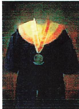
Fakultas Ilmu Sosial dan Ilmu Politik