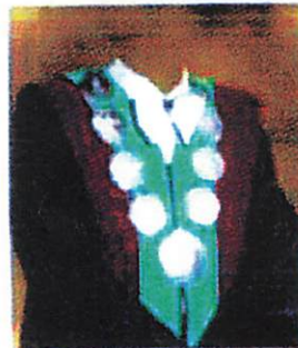
Fakultas Bahasa dan Sains