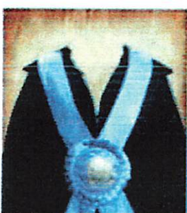
Fakultas Ekonomi dan Bisnis