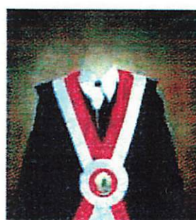
Fakultas Kedokteran Hewan